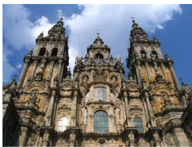
Cathédrale de Saint-Jacques-de-Compostelle

Il faut cependant ajouter le coût du transport au prix de la location de l'âne, par exemple : 300 € pour conduire l'âne au Puy en Velay ; 350 € pour le rapatriement de Santiago.